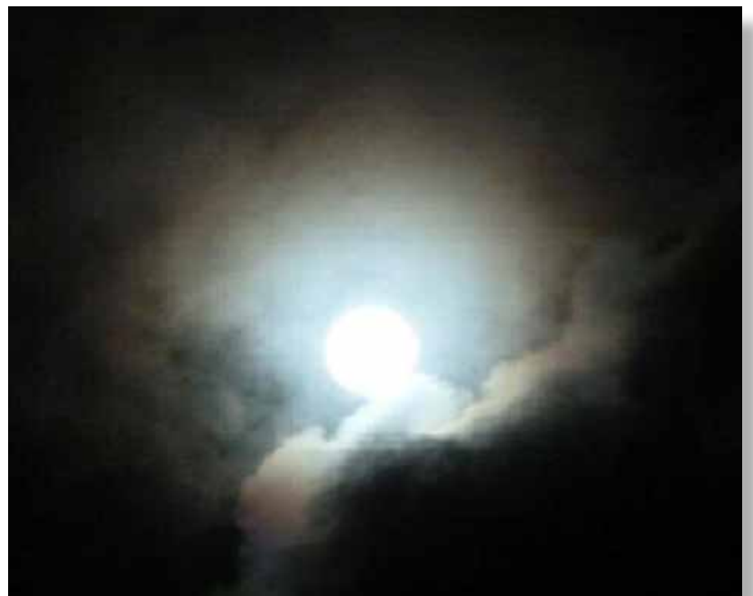
Luna llena en el Congreso Australiano.

Regresando a la analogía de la mezquita: ¿cómo se puede construir un edificio sin planes? Bapak como el primero en recibir el latihan y establecer Subud, de seguro sabía lo que estaba haciendo. A él se le refería como el Guía Espiritual porque había estado allá y nos podía señalar el camino. Como el arquitecto continúa >