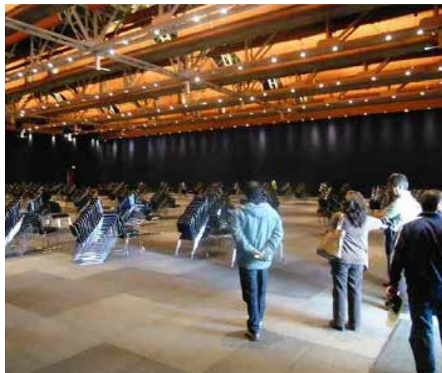
Espacio de latihan para el Congreso Mundial

• La Plaza Central del Centro de Convenciones será la principal área de reunión. Es el lugar para encontrarse fácilmente con los viejos amigos que no se han visto desde el último Congreso Mundial, y de paso hacer nuevos amigos. Por la tarde se convertirá en un lugar de presentaciones nocturnas y área de encuentros. Vendedores locales tendrán la responsabilidad de suministrar jugos naturales, te, café y bocadillos locales mexicanos.