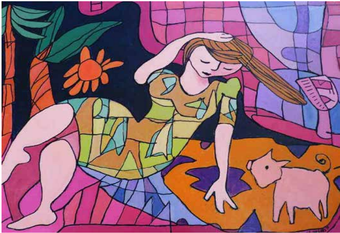
Una pintura hecha por Arifa.