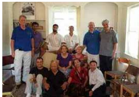
Washington DC miembros y familia.

Aún estamos a unos pocos meses de haberlo ocupado esperando su terminación de geotérmica, HVAC, terminación interior, electricidad, puertas, conexión hidráulica, aceras, cubierta y paisajística. Pero la alegría de tener el edificio haciéndonos señas es inconmensurable.