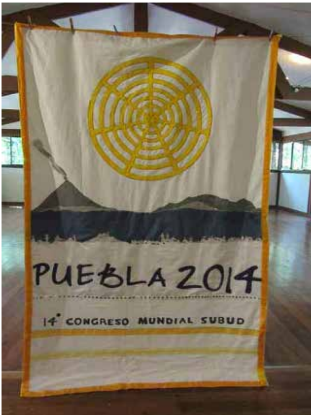
< Bandera del Congreso Mundial.