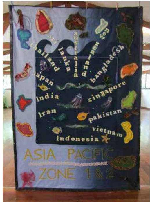
Bandera de la Zona Asia- Pacífico. (falta un país, pero este se añadió después de tomarse la foto.)