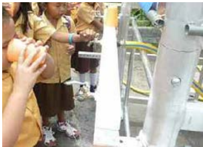
Suministrando agua limpia a los más desposeídos en Yakarta

El excelente proyecto de Agua Limpia en Yakarta suministra agua limpia y potable a algunas de las gentes más pobres de esa ciudad.