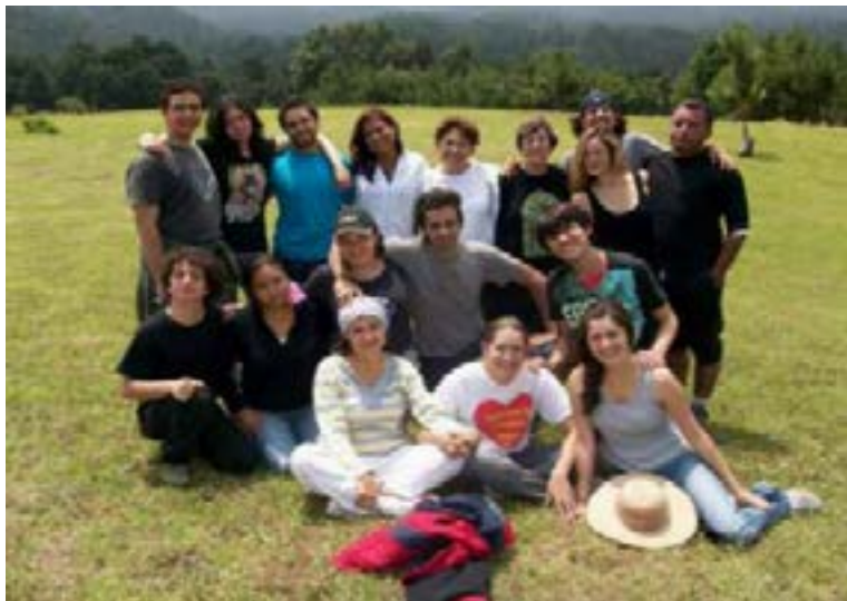
Fuerzas Humanas en México 2010.

Luego de haber tenido campamentos exitosos entre el 2009 y el 2012, Fuerza Humana llevará a cabo su quinto campamento de conjunto con el miembro de SDIA Un Jardín de Paz del Niño durante la última semana de julio, antes de que comience el congreso. Allí la Fuerza ayudará a crear un jardín en una pre-escuela para niños desfavorecidos en Puebla, a fin de que puedan conectarse con el mundo natural.