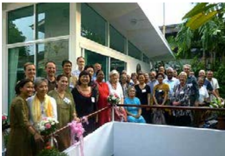
Asistentes a la reunión zonal en la nueva Casa Subud.