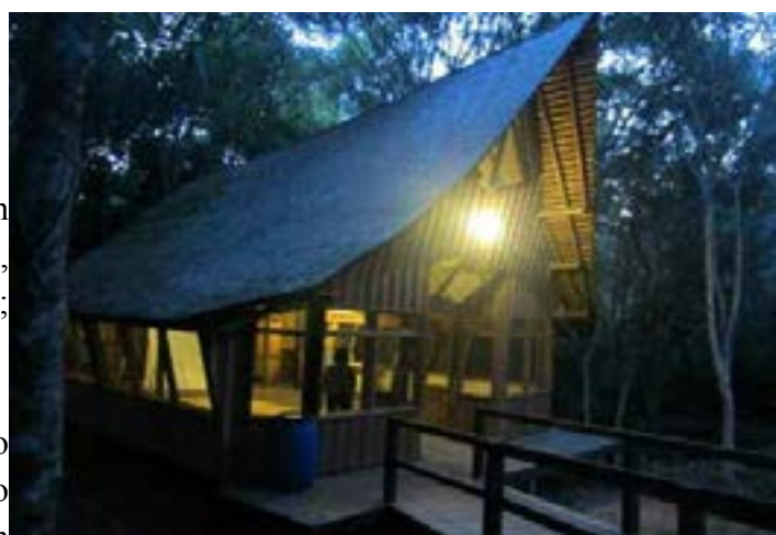
Kedung Jati Kafe en Rungan Sari, otro logro de esta muy activa y productiva Zona.