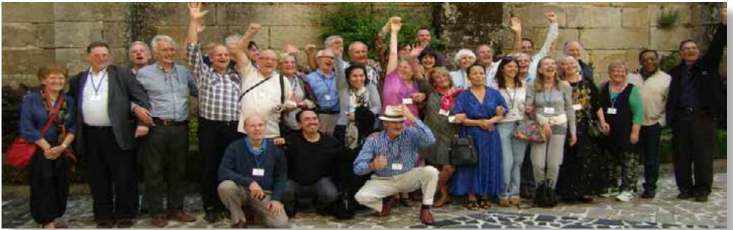
El Consejo Mundial Subud

La mejor de todas las noticias que salieron de la reunión fue que las autoridades de Puebla han decidido darnos el Centro de Convenciones gratis, lo que representa un ahorro de $150,000 para nosotros.