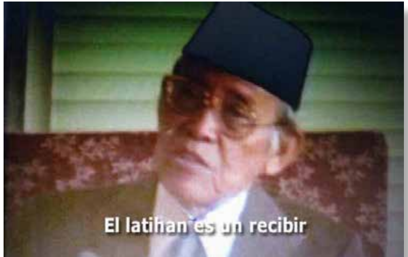
Algunas charlas de Bapak e Ibu están ahora disponibles con subtítulos.

Permite que las charlas se sientan más directas, al escuchar las palabras en indonesio y verlas simultáneamente impresas sobre la pantalla, en lugar de tener que esperar por una traducción. Siento como si Bapak e Ibu me estuvieran hablando directamente. Pienso que para quienes hablan indonesio la experiencia de oír y simultáneamente entender siempre ha estado disponible, pero ahora también lo está para el resto de nosotros.