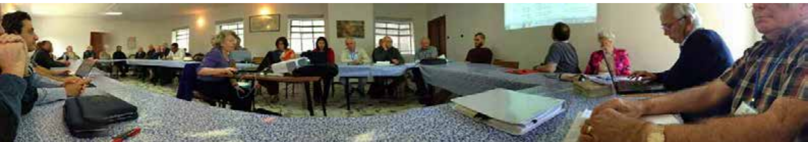
El WSC trabajando.

El alcalde local dio la bienvenida al Consejo Mundial Subud al inicio de la reunión de este año en Poio, un pequeño pueblo de Galicia, no lejos de la frontera con Portugal. Una banda de músicos locales tocaron música tradicional y los miembros del WSC bailaron en la plaza del pueblo, en el exterior de la iglesia monasterio de San Juan. Debido a que el Consejo había llegado durante un fin de semana festivo hubo fuegos artificiales y sardinas en la playa, por la tarde, para marcar la plenitud del verano, lo que significó la disponibilidad de agradables entretenimientos entre reunión y reunión.