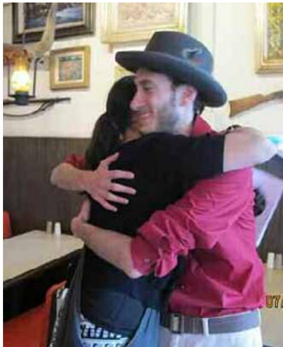
¡Un abrazo! En el Congreso de Subud USA

¡El entretenimiento vespertino fue muy divertido! Cantantes, poetas, músicos y comediantes dejaron una inolvidable y bella impresión del evento. Indudablemente, fue un viaje para el corazón y las almas. Además, fue una maravillosa oportunidad de ver la cultura y el estilo de vida en los estados sureños de los Estados Unidos de América; una Meca para los pintores, la Tierra del Encantamiento, “Uno de Nuestros Cincuenta Falta”.