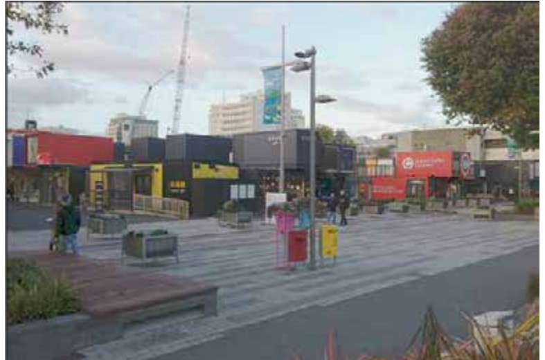
Cashel Mall o "ciudad contenedor" o "recomenzar" un área donde los negocios han hecho un uso creativo de los contenedores para retornar a la ciudad. Esto queda cerca de donde la mayoría de las tiendas solían estar.

Bueno la devastación fue significativa. Ya no existen ni la sala Caledonia, ni el Centro de Congresos, ni la cafetería del metro, ni el hotel Crown Plaza. De hecho, dos años después del terremoto en febrero del 2011, los edificios de la ciudad aún se están demoliendo, y conducir por muchas carretas todavía es cómo viajar en una montaña rusa. Muy poco se ha hecho en cuanto a la reconstrucción y muchos creen que tomará al menos diez años en terminarse.