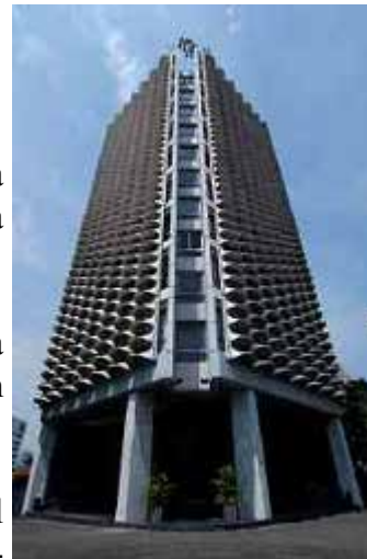
El Centro S. Widjojo en Yakarta donde se ubicó el Banco Susila Bakti