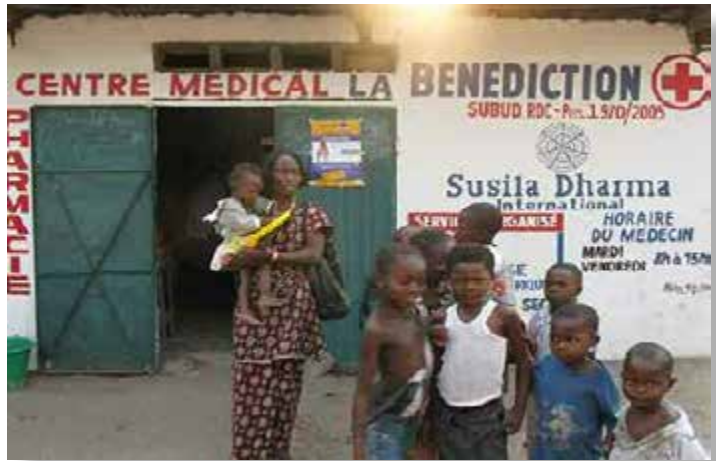
Clínica Lemba Imbu.