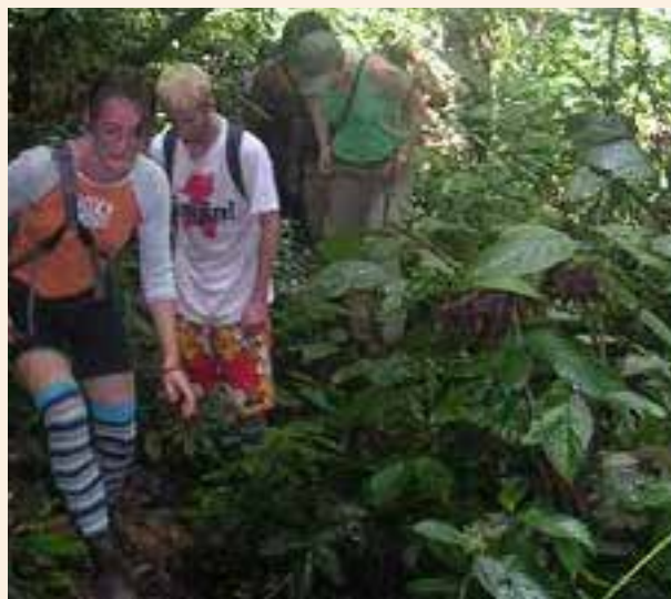
Jóvenes en el YES Quest en Kalimantan

SYAI y el equipo de YES Quest están trabajando en conjunto en esta iniciativa como parte del plan para pasar el Subud YES Quest a SYAI para el 2016. La colaboración espera que los otros consejos nacionales les imiten y patrocinen a gente joven de sus países y hasta de sus zonas. Esto ofrece a los miembros Subud un camino directo para invertir en el crecimiento de la gente joven y finalmente en el crecimiento de Subud.