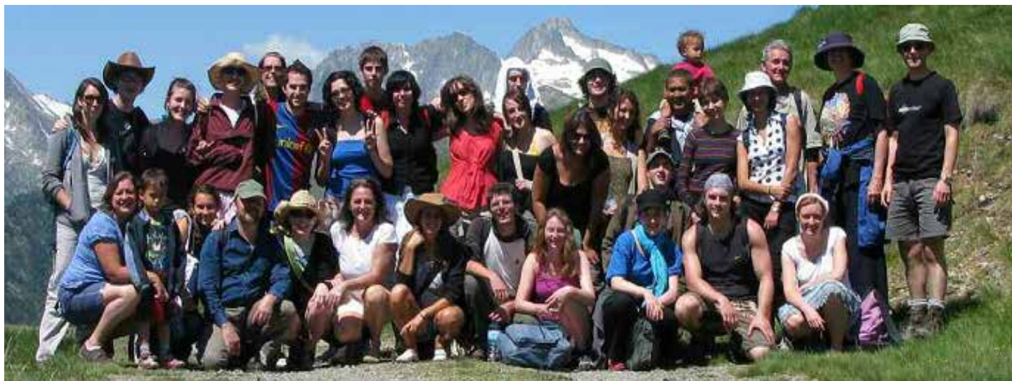
Un Encuentro de Juventud en La Source. Ahora tendrá lugar allí un YES Quest para adultos

“La experiencia del YES Quest comenzó una muy importante recomposición de la vida. Los facilitadores aportan una riqueza de enfoques creativos para el auto descubrimiento que finalmente y guiados por la fortaleza de las creencias lleva a lo que realmente importa. Estoy muy agradecida al equipo por su maravillosa combinación de cuidado, diversión y creatividad y por este extraordinario programa. Hoy estoy mucho más feliz, viviendo una vida que tiene mucho más sentido. Recomendaría este programa sin reserva a cualquiera.”