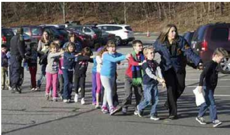
La policía escolta a los niños desde la escena del crimen en Sandy Hook.