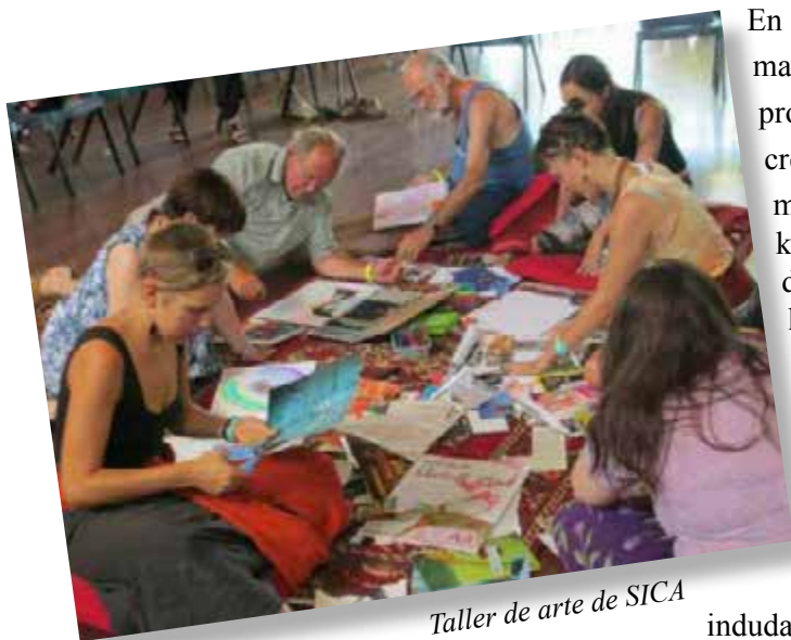
Taller de arte de SICA