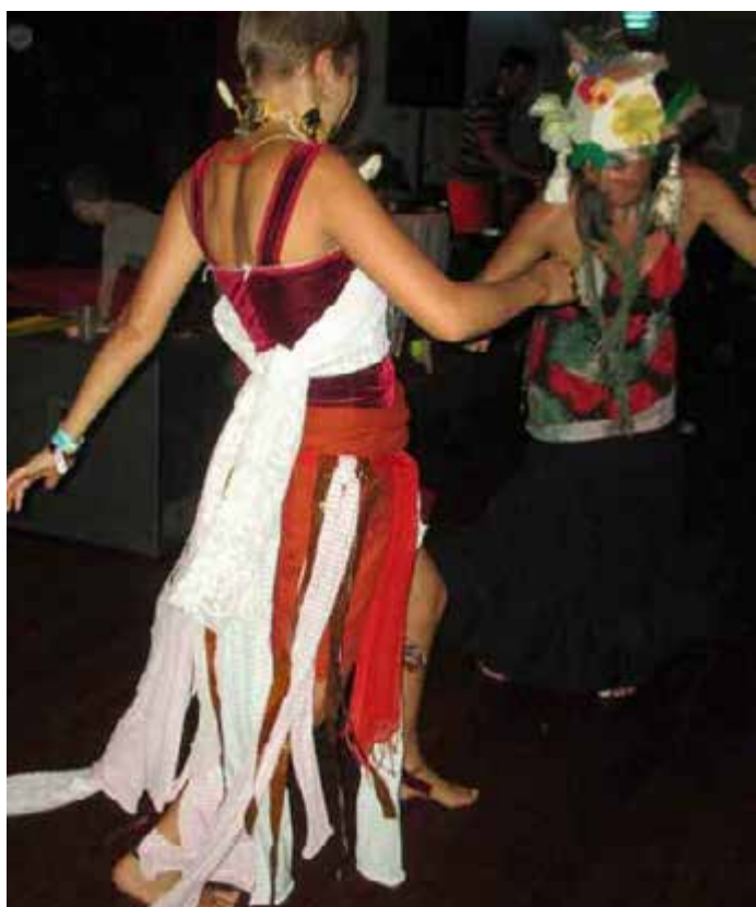
Bailadoras en el Baile Magnifico e Interno.