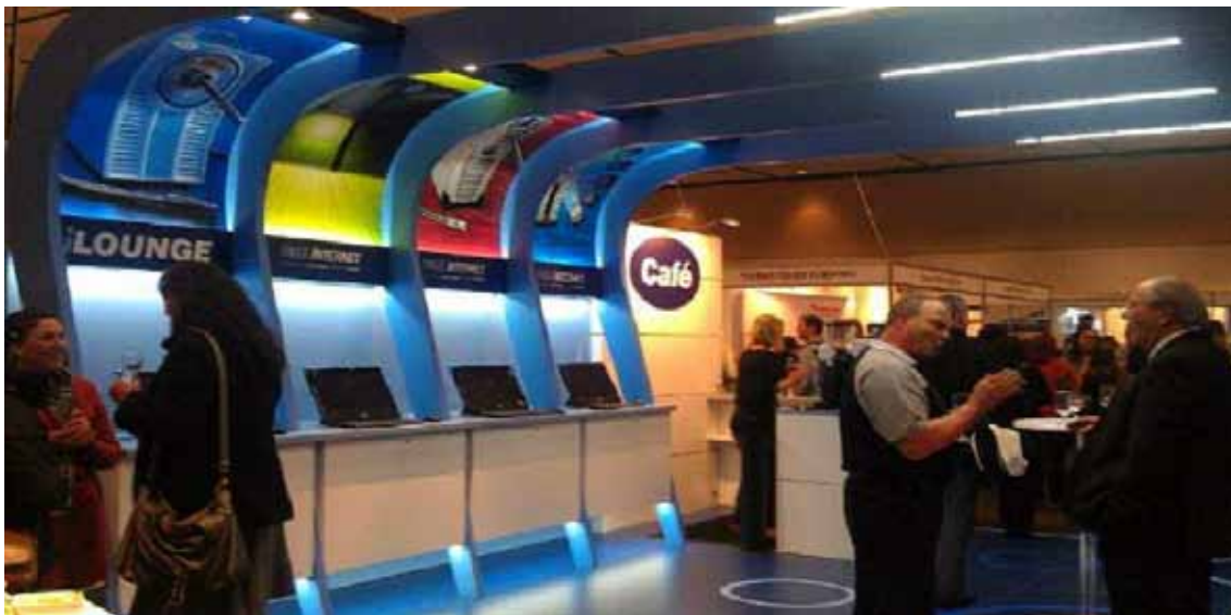
El estante de Rofin en la Conferencia de Ciencia Forense en Hobart. Diseñado por Latif Vogel.