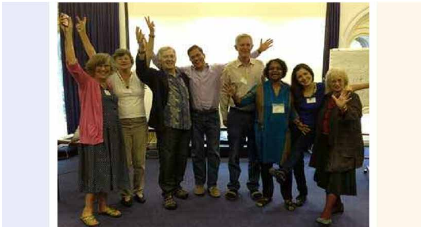
¡Saludos de la Reunión Anual General de SDIA en Inglaterra!

Tuvimos una muy exitosa reunión en Great Malvern, Inglaterra, desde el 22 hasta el 25 de agosto y quiero agradecer a todos los que pudieron venir y contribuir juntos a nuestro productivo y agradable tiempo. Les estoy enviando la versión en inglés de los borradores de las actas de la Reunión Anual General y un documento resumiendo los resultados de nuestro tiempo juntos, con una lista de los miembros que asistieron. Las traducciones les llegarán pronto.