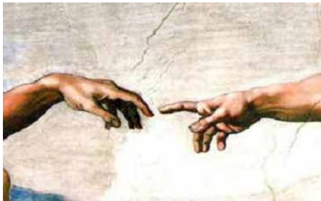
Dios y Adán contactan entre sí en la pintura de la creación de Miguel Angel

Aquí está la canción de Joan Osborne en Youtube http://www.youtube.com/watch?v=USR3bX_PtU4