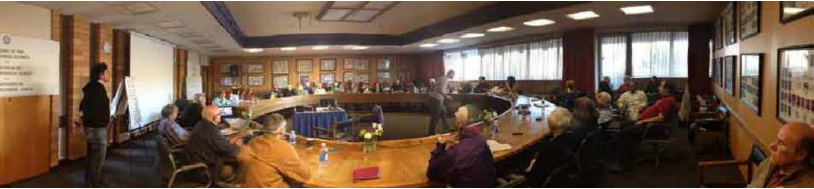
El Consejo Mundial Subud en Vancouver.