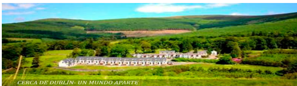
CERCA DE DUBLÍN - UN MUNDO APARTE

Teléfono 00353 404 42884 o Matthew al 00353 872561074