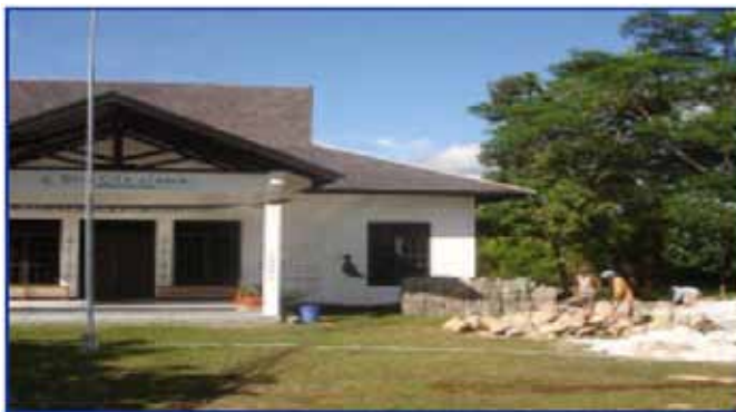
Comienza la construcción de las nuevas aulas para la escuela BCU

Ahora la tarea es continuar. El objetivo es alcanzar el total para fines de junio. Esto permitiría un amplio tiempo para que, quienes reciban subvenciones puedan hacer reservaciones y obtener visas para Nueva Zelanda. En la medida que se otorguen las subvenciones, divulgaremos los nombres y fotos de los beneficiarios, para que se familiaricen con algunos de los jóvenes Subud de todo el mundo.